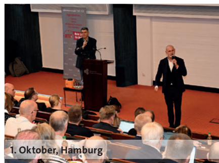
1. Oktober, Hamburg