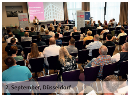
2. September, Düsseldorf

Die erste Regionalkonferenz fand am 2. September 2024 in Düsseldorf statt. Die