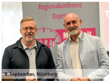
9. September, Nürnberg