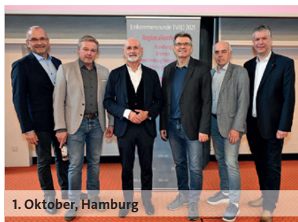
1. Oktober, Hamburg