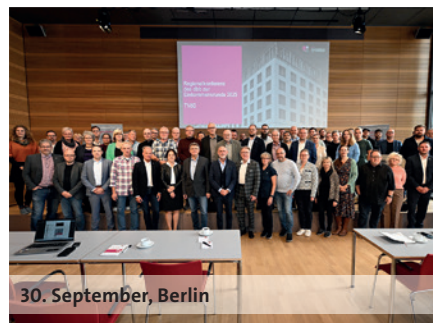
30. September, Berlin