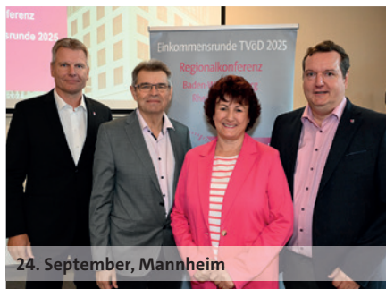
24. September, Mannheim