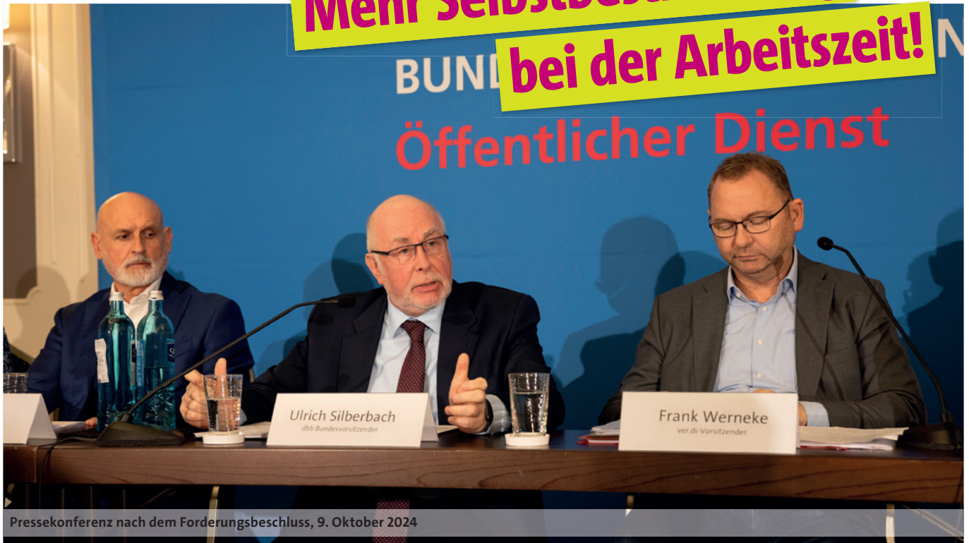
Pressekonferenz nach dem Forderungsbeschluss, 9. Oktober 2024

„Ja, unsere Forderungen sind ambitioniert“, stellte dbb Chef Ulrich Silberbach auf der Pressekonferenz klar, bei der dbb und ver.di am 9. Oktober 2024 in Berlin ihre gemeinsamen Forderungen für die anstehende Einkommensrunde mit Bund und Kommunen vorstellten. „Aber sie sind keineswegs zu hoch. Sie messen sich an dem, was ein zukunftsfähiger öffentlicher Dienst braucht, und nicht an dem, was sich Bundesinnenministerin und Bundesfinanzminister sowie Stadtkämmerer wünschen würden. Wir brauchen endlich Entlastung für die Kolleginnen und Kollegen, die unser Land am Laufen halten und die Arbeit der 570.000 fehlenden Beschäftigten im öffentlichen Dienst miterledigen. Und wir müssen endlich attraktiver werden, um diese offenen Stellen besetzt zu bekommen. Wir können in der anstehenden Einkommensrunde unseren öffentlichen Dienst zukunftsfester machen, wir können aber auch die Zukunft ein Stück weit verspielen, wenn