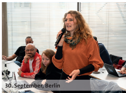
30. September, Berlin