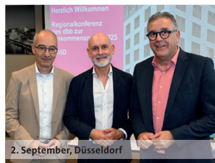
2. September, Düsseldorf