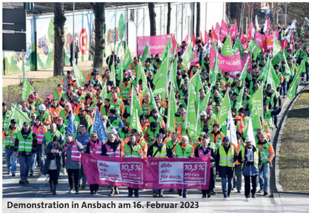
Demonstration in Ansbach am 16. Februar 2023

In Bayern und Berlin haben am 16. Februar 2023 zahlreiche dbb Gewerkschaften die Forderungen in der aktuellen TVöD-Einkommensrunde tatkräftig unterstützt.