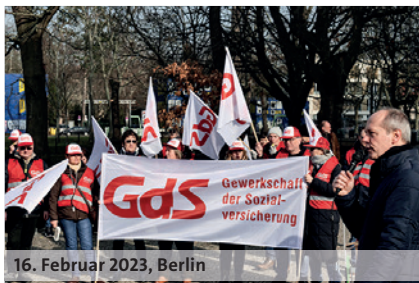
16. Februar 2023, Berlin