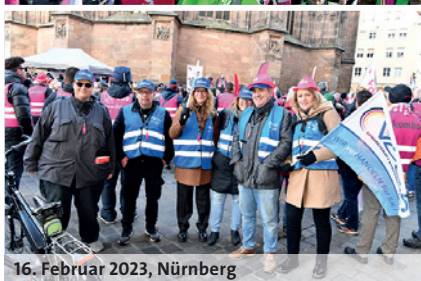
16. Februar 2023, Nürnberg