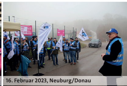
16. Februar 2023, Neuburg/Donau