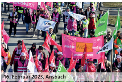
16. Februar 2023, Ansbach

dbb: wir. für euch. 10,5% 500 Euro mindestens